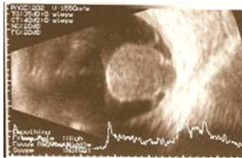
Figura 3. Ecografía en modo a y b de melanoma de coroides en forma de hongo