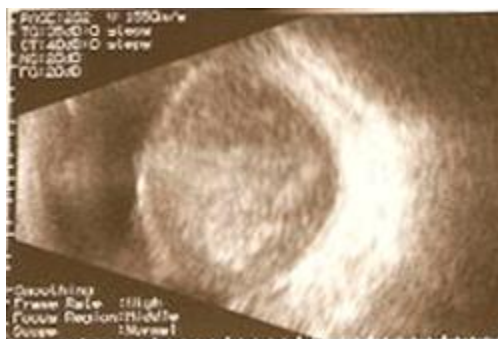
Figura 1. Ecografía en modo b de melanoma de coroides

FO: OD: lesión temporal inferior rodeada de desprendimiento exudativo de retina. OI: Normal