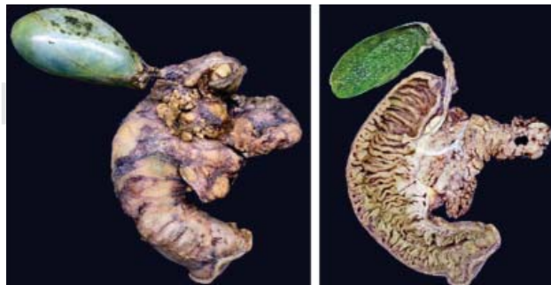
Figura 1. Resección en bloque; se muestra toda la pieza que es enviada a patología, incluyendo la cabeza de páncreas, antro gástrico, duodeno, vía biliar extrahepática y vesicular biliar.