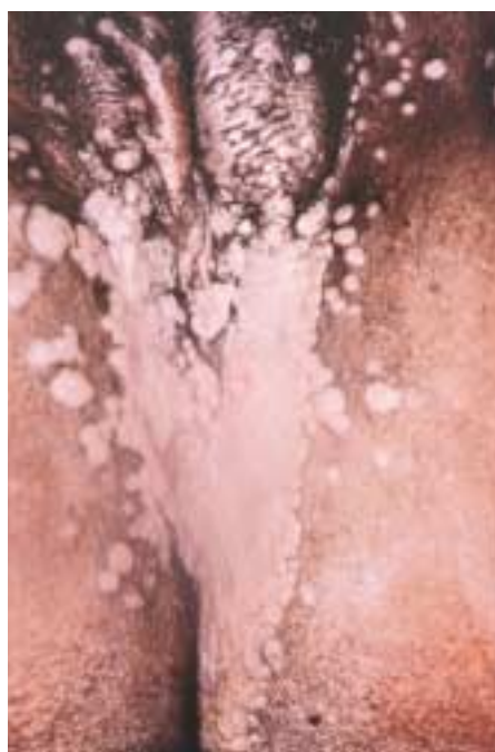
Figura 5. Condilomas planos de la región genitoanal, macerados y con olor fétido, generalmente poseen una gran cantidad de espiroquetas y son más infecciosas que otras lesiones secas. El título de VDRL fue 1:128.

complejos de antígeno-anticuerpo-complemento, hallazgo que sugieren una glomerulonefritis causada por los inmunocomplejos depositados en los capilares del glomérulo.