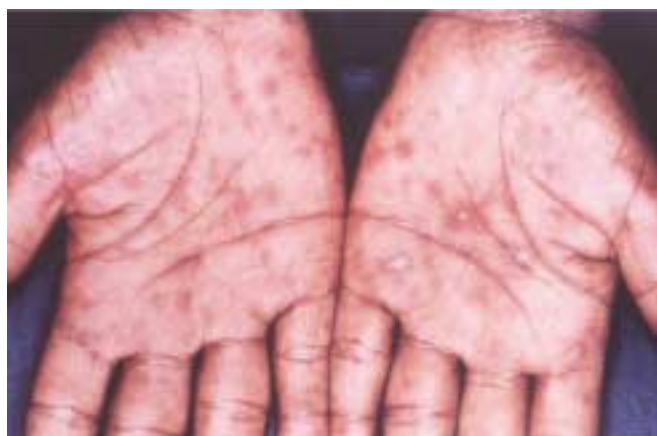
Figura 3. Superficies palmoplantares con lesiones redondeadas y planas. Este paciente tenía adenopatías no dolorosas, firmes y discretas a la palpación.