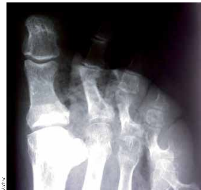
Radiografía de pie diabético.

la de nicotinamida adenina dinucleótido oxidada (NAD + ) en sus 2 componentes, el ácido nicotínico y la ADP-ribosa, y posteriormente sintetiza polímeros de ADP-ribosa, estos polímeros se acumulan y adhieren a la G3PDH y otras proteínas nucleares provocando alteraciones en la estructura y función de dichas proteínas. Por esta razón, en diabéticos, el nivel del gliceraldehído-3 fosfato (G3P) se encuentra elevado al no poder ser metabolizado por la G3PDH, y la acumulación de G3P activa cuatro mecanismos diferentes de daño tisular: glucosilación de proteínas y formación de productos finales de la glucosilación avanzada; activación de las vías del sorbitol, de las hexosaminas y de la proteína cinasa C 10,12,14,15,19,20 ( figura 1 ).