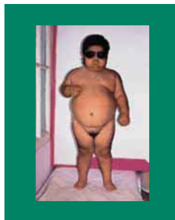
Figura 3. Paciente con síndrome de Cushing. Otros datos propios de este síndrome son: osteoporosis, poliuria, polidipsia, hipertensión, resistencia a la insulina, exceso de hormona andrógena (es más frecuente en el carcinoma adrenal).

Esta situación de indefinición sexual es de gran importancia porque las deidades en la cosmovisión e ideología de los pueblos mesoamericanos tenían la característica de ser seres bisexuales, androgénicos, hombre-mujer. Eliade M 3 señala que para este tipo de pueblos los únicos seres perfectos son precisamente sus deidades, por ello la deidad puede ser femenina y masculina de manera simultánea, mientras que el ser humano sólo puede estar indefinido durante su infancia, pero al llegar a la adolescencia, es preciso definirlo a través de los ritos de paso porque los seres humanos somos imperfectos e impuros.