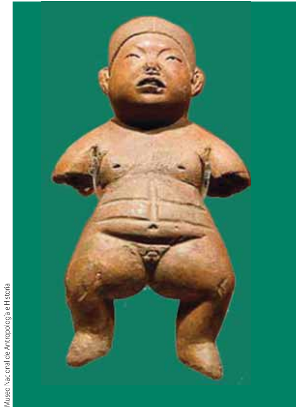
Museo Nacional de Antropología e Historia