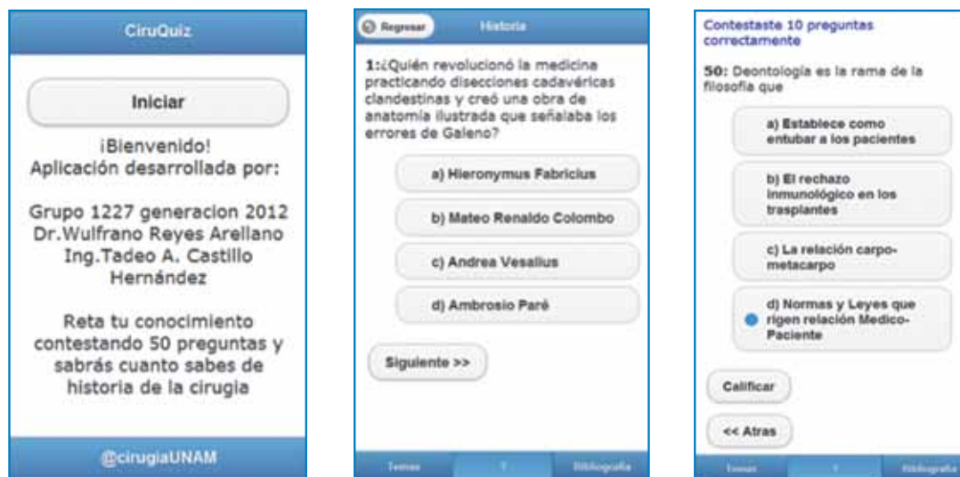
Figura 2. Aplicación en el teléfono celular: a) Pantalla de bienvenida. b) Cuestionario tal como se ve en la pantalla del celular. c) Pantalla de respuesta.

El resultado del esquema de la figura 1 es la apli-