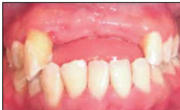
Figura 3. Resultado del tratamiento periodontal, extracciones dentales y control de la diabetes al cabo de 6 meses. Paciente en condiciones de rehabilitarse mediante prótesis.

Microorganismos como la P. gingivalis , Tannerella forsythia y Prevotella intermedia incrementan en el suero los niveles de MMP-9, proteína C reactiva, IL-6 y fibrinógeno. Asimismo, la diseminación hematogena de las bacterias y sus productos (lipopolisacáridos y proteínas de la pared) inducen un estado inflamatorio crónico que dificulta el control glicémico, de ahí que se especule que al controlar el proceso inflamatorio local, el adecuado tratamiento periodontal ayuda a controlar la glicemia al disminuir las citocinas circulantes. El concepto de influencia bidireccional, en la que una enfermedad empeora o contribuye a controlar a la otra es de gran importancia ya que permite comprender que el manejo de ambas entidades, diabetes y periodontitis, debe ser simultáneo. La terapia periodontal puede por lo tanto no ser exitosa si el paciente diabético no logra controlar la enfermedad sistémica y, de igual manera,