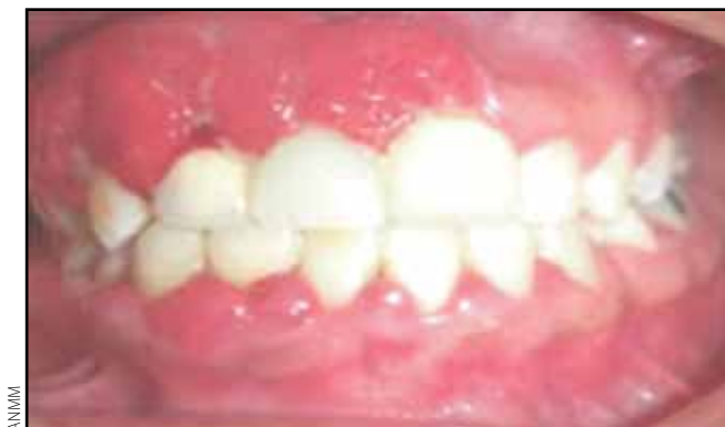
Figura 2. Paciente diabética no controlada con enfermedad periodontal grave.

En los últimos 50 años se ha visto que al realizar terapia periodontal, procedimientos quirúrgicos localizados, extracciones selectas y la prescripción de tetraciclinas (antimicrobianos con acción antiinflamatoria) a pacientes diabéticos, éstos suelen requerir una dosis menor de insulina o presentan mejores respuestas a los hipoglucemiantes orales que aquellos a quienes no se les realizó dicho tratamiento periodontal. En algunos estudios se ha observado que junto con el mejoramiento periodontal hay una reducción del 10% de los valores base de la hemoglobina A1c. Así como las infecciones virales y bacterianas generan resistencia a la insulina en individuos con diabetes y dificultan el control de la enfermedad, la microbiota gramnegativa responsable de la periodontitis también lo hace.