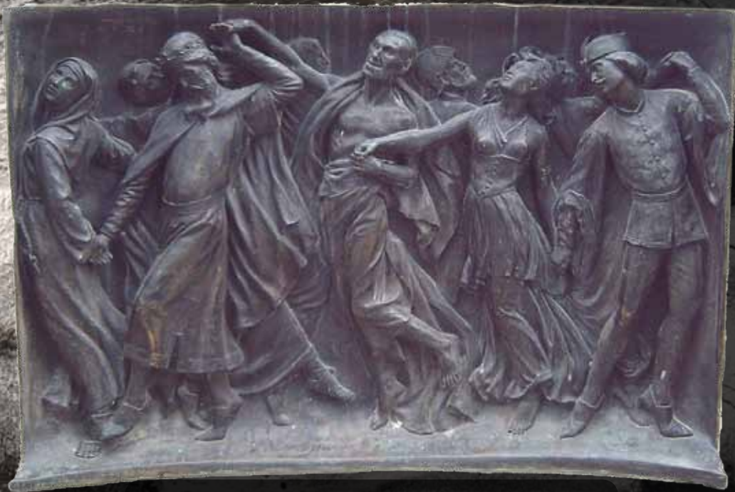
Danza de la muerte (Monumento a Pedro Calderón de la Barca, 1878).