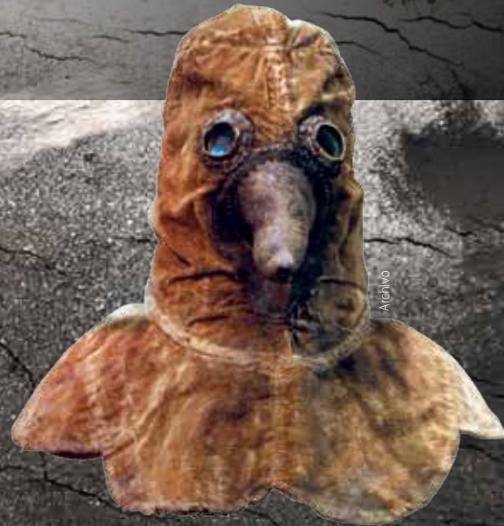
Máscara usada por los médicos para visitar a los enfermos durante la peste.

La lucha contra esos enemigos microscópicos