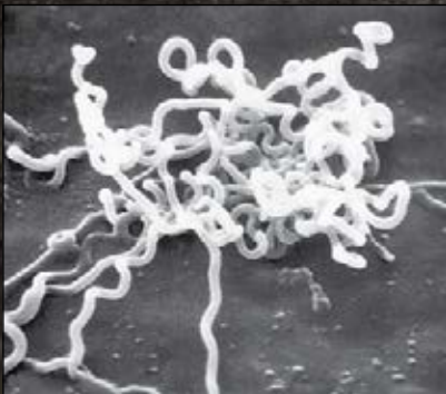
Treponema pallidum , causante de la sífilis.