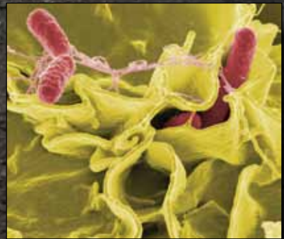
Salmonella typhi .