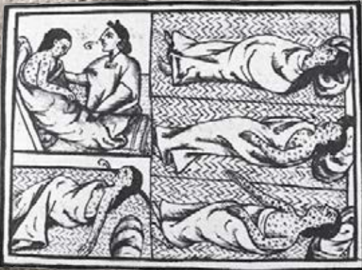
La epidemia de huey cocoliztli en México.