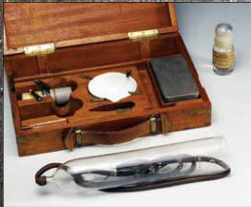
Equipo para tratar la sífilis diseñado por Ehrlich (1910).