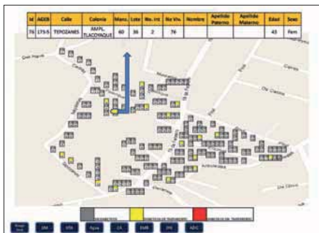
Figura 2. Pantalla de salida del mapa con los problemas de salud referenciados (situación de la diabetes).

en locaciones ubicadas dentro de ella (casas, locales vecinales, asociaciones, etc.), en todas han estado presentes directivos de los centros de salud y de la jurisdicción sanitaria, las trabajadoras sociales y el personal asignado al módulo de atención ( figura 2 ).