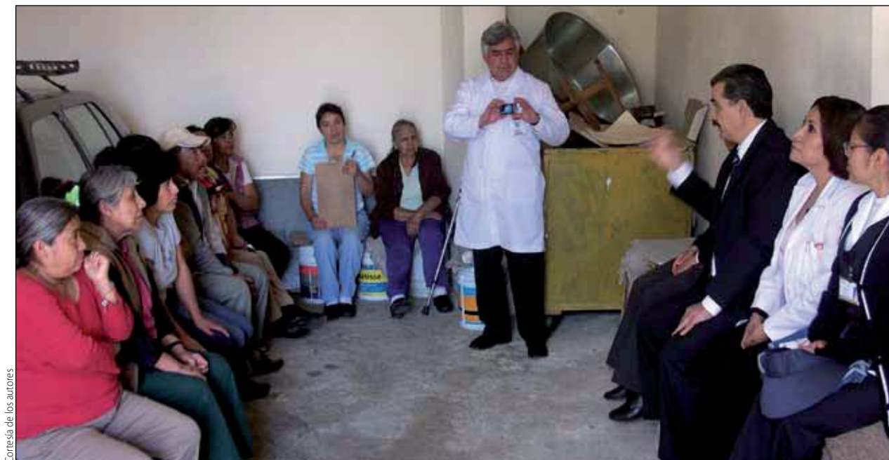
Figura 3. Algunas de las reuniones realizadas con vecinos de la comunidad.

la familia en la reinserción de los menores, en conjunto con instituciones educativas de la zona; a su vez, canaliza el problema a la jurisdicción sanitaria en busca de una respuesta institucional de mayor envergadura. De la misma manera se vincula mediante la jurisdicción sanitaria, para que a través del Instituto Nacional para la Educación de los Adultos (INEA) se pueda incorporar a aquellos adultos que no concluyeron sus estudios, o a aquellos que son analfabetos y desean aprender.