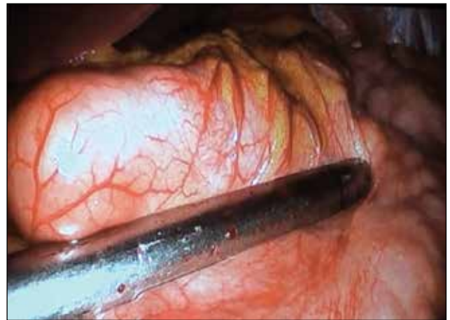
Figura 3. Colocación de grapas para crear el neoestómago