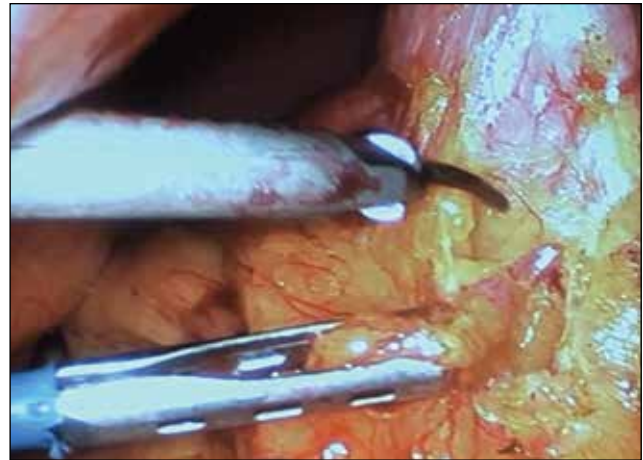
Figura 2. Disección con bisturí ultrasónico

La ghrelina, hormona orexígena descubierta en 1999 por Kojima y cols., comprende otro mecanismo más por el cual se podría explicar la pérdida de peso observada en MGL 18 . Esta hormona es producida en su mayoría (65-90%) por células X/A de las glándulas oxínticas situadas principalmente en el fondo gástrico 19 . Aún no se comprenden por completo sus aspectos fisiológicos, esto se debe a la ubicuidad de los receptores de ghrelina ( growth hormone secretagogue receptor ), aunque se ha demos-