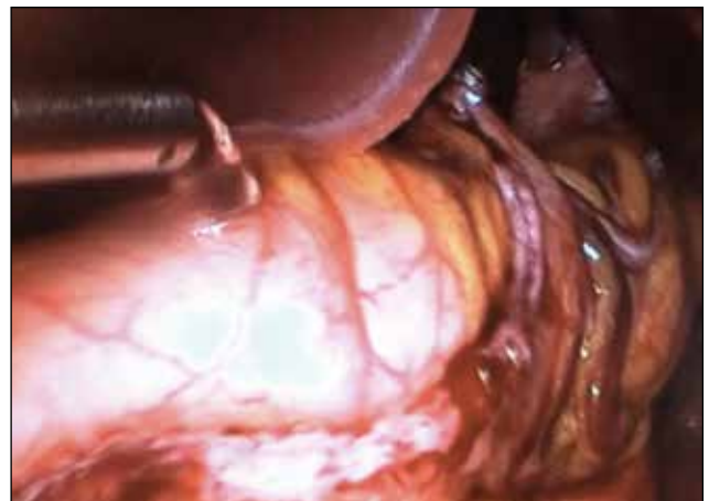
Figura 4. Se corrobora hermeticidad de grapas/sutura