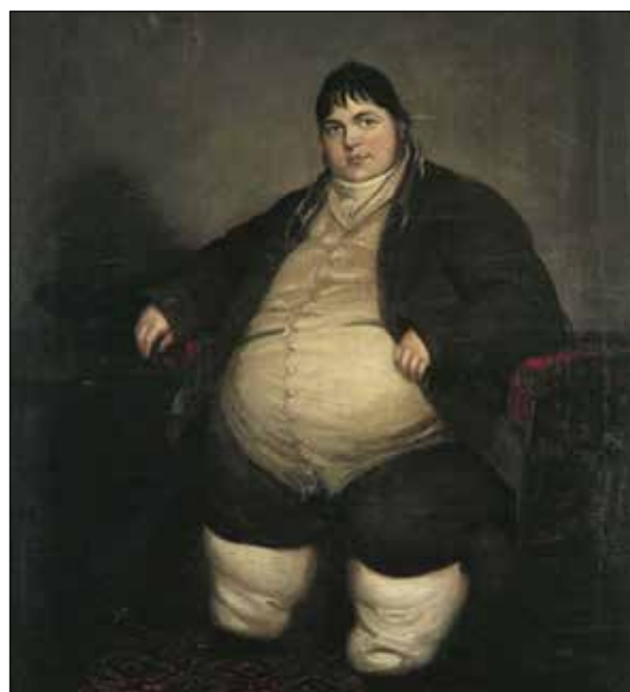
Retrato de Daniel Lambert, s. XIX, Inglaterra

La obesidad cuenta con varias comorbilidades que ya fueron mencionadas, éstas son causa de enorme preocupación tanto médica como en el aspecto de salud pública 30 . En la fisiopatogenia más aceptada para la causa de obesidad y sus comorbilidades radica un incremento en la secreción de proteínas por parte de los adipocitos (llamadas adipocinas o adipocinas) 31 , por el efecto compresivo o el peso adicional que proporciona el tejido adiposo exce-