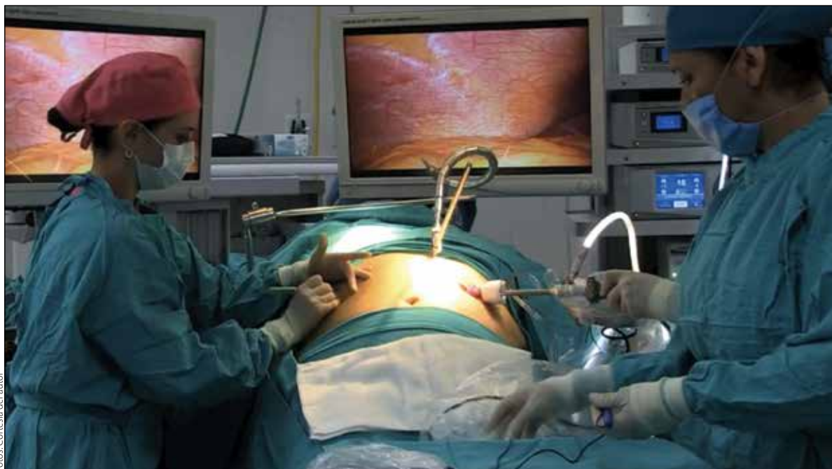
Figura 1. Inserción de trocares

índice de masa corporal (IMC) 30-35 kg/m 2 con la justificación de comorbilidades ya determinadas (diabetes mellitus [DM], hipertensión arterial sistémica, dislipidemias, síndrome de apnea obstructiva del sueño, cáncer, etc) 13 . Esto difiere de la mayoría de instituciones y organizaciones que hasta el día de éste escrito sólo justifican la cirugía bariátrica con IMC \geq 35 kg/m 2 mas las comorbilidades mencionadas 14 . Las indicaciones para MGL están descritas en la tabla 1 .