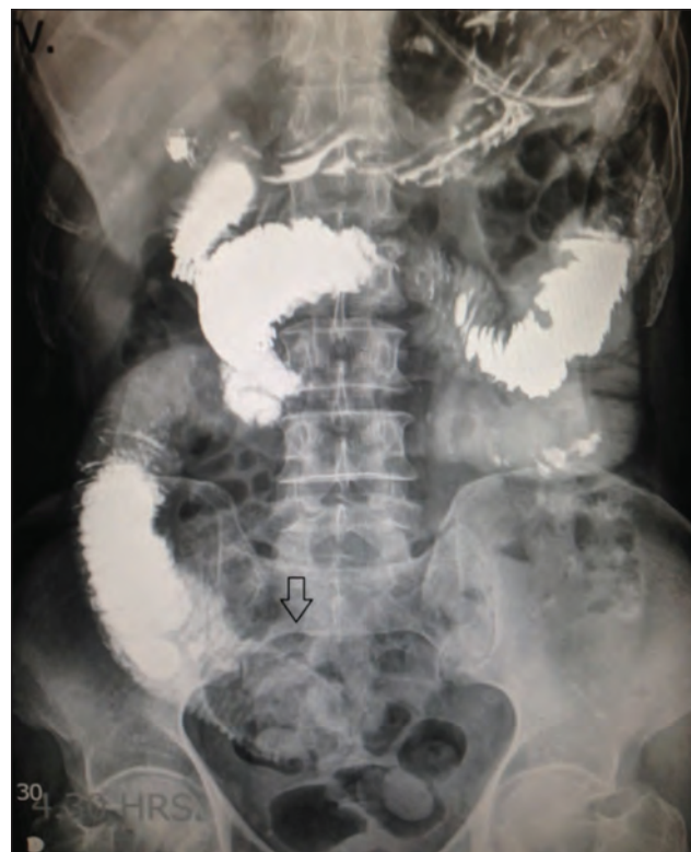
Figura 2. Tránsito intestinal con imagen ovoidea en intestino delgado que impide el paso del medio de contraste. 4:30 h posterior a la ingesta del medio de contraste (flecha).

tintervención quirúrgica en el 75% de los casos. La segunda causa son las hernias inguinales, femorales o ventrales 1 .