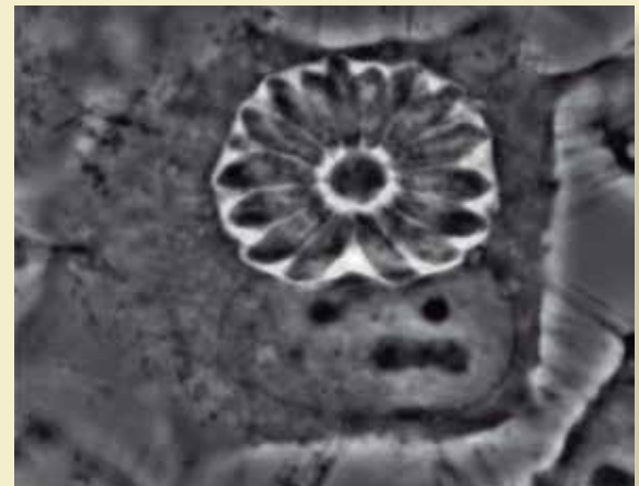
Figura 2. Fotomicrografía tomada con objetivo 100x, ooquiste infectante esporulado de Toxoplasma gondii de forma oval y que contiene 2 esporoblastos con 4 esporozoítos cada uno. En el recuadro se aprecia una animación más clara de la morfología.