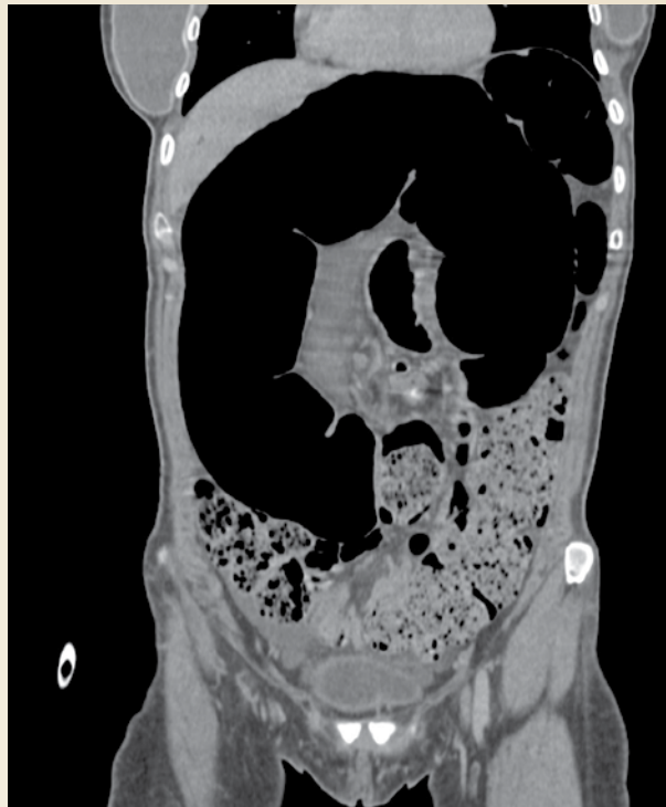
Figura 2. Tomografía computada contrastada en corte coronal