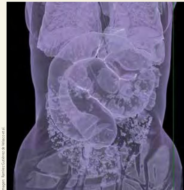
Figura 3. Reconstrucción volumétrica en 3D