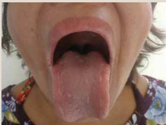
Figura 2. Queilitis angular y glositis atrófica