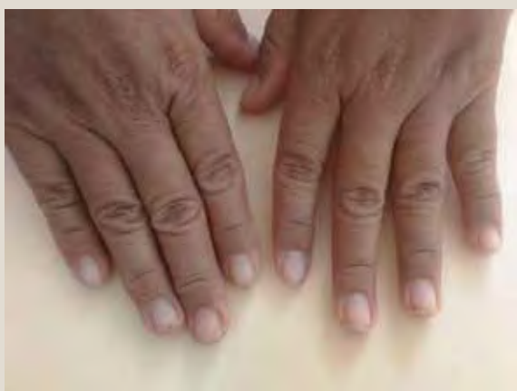
Figura 3. Uñas quebradizas y pálidas

física fue notable la palidez conjuntival, queilitis angular, fisuras labiales leves, así como dificultad para la apertura bucal ( figura 2 ); uñas pálidas con tendencia a la coloración amarillenta, quebradizas ( figura 3 ).