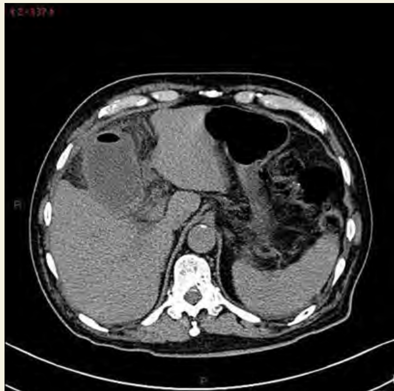
Figura 2. Tomografía de abdomen simple en plano axial cortes inferiores a la imagen A