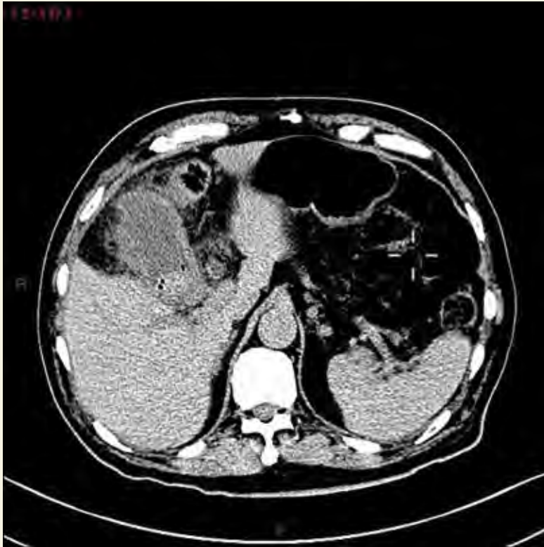
Figura 1. Tomografía de abdomen simple en plano axial