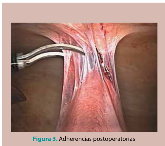
Figura 3. Adherencias postoperatorias

ma la ingesta de alimentos, también la secreción gástrica, por lo que se debe estar consciente de que a pesar de que los pacientes con obstrucción mecánica se encuentren en ayuno de varios días, no significa que el estómago se encuentre «vacío», y recordar que existen partículas que no podrán ser aspiradas, así como tampoco los contenidos semisólidos.