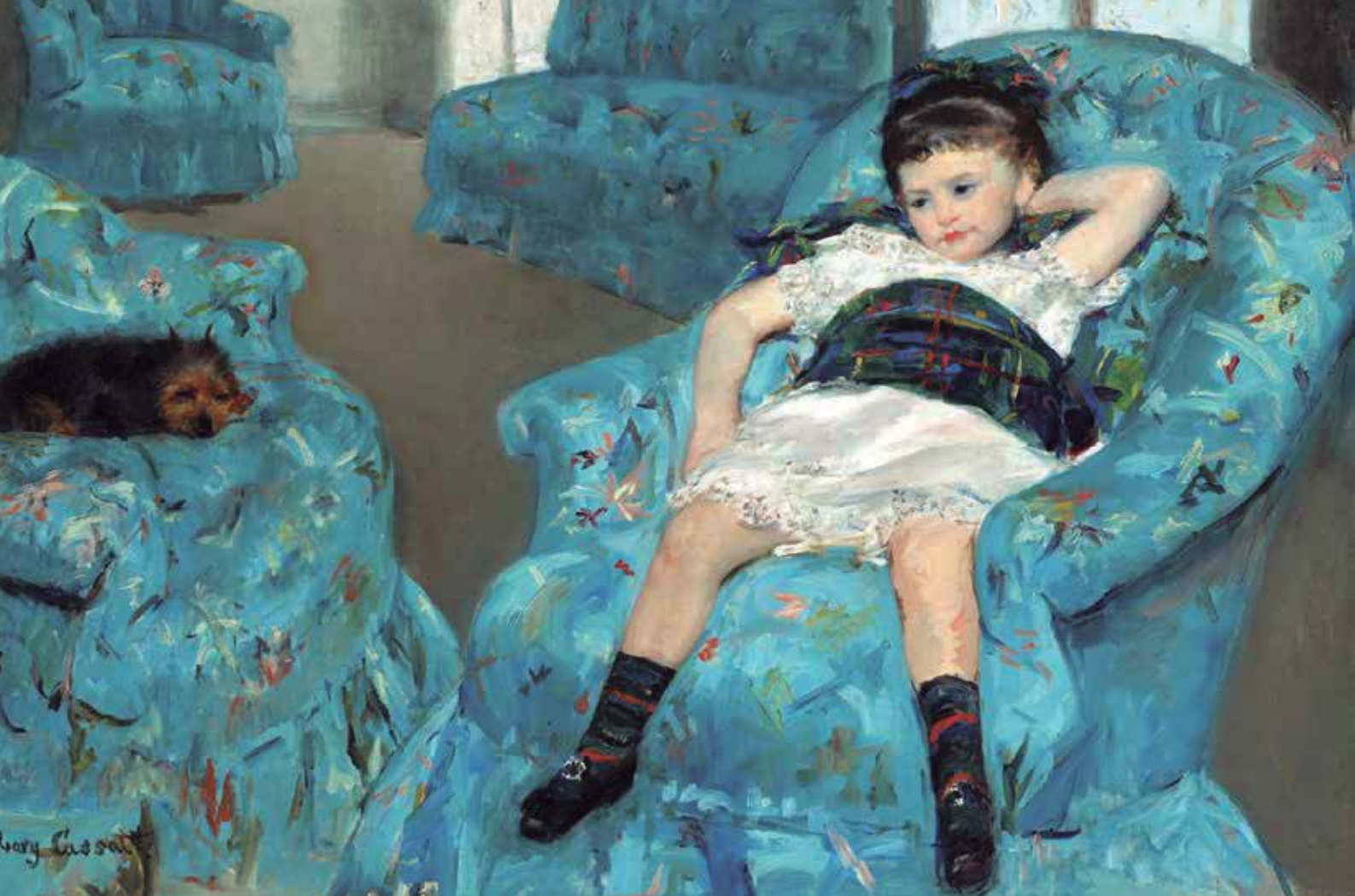
Niña en un sillón azul

He intentado emocionar a la gente con mi arte, en mis cuadros he intentado mostrar el amor y la vida. No hay nada que pueda compararse a la alegría de un artista al pintar.