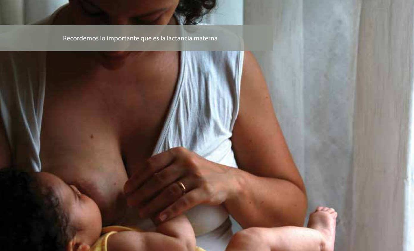
Imagen: Luiza Braun