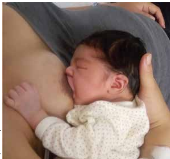
Imagen: Morales López et al.