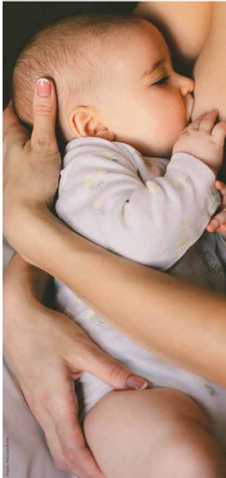
Imagen: Anacrajin Borjho

Aproximadamente entre los 7 y 10 días postparto el calostro va cambiando la proporción de sus