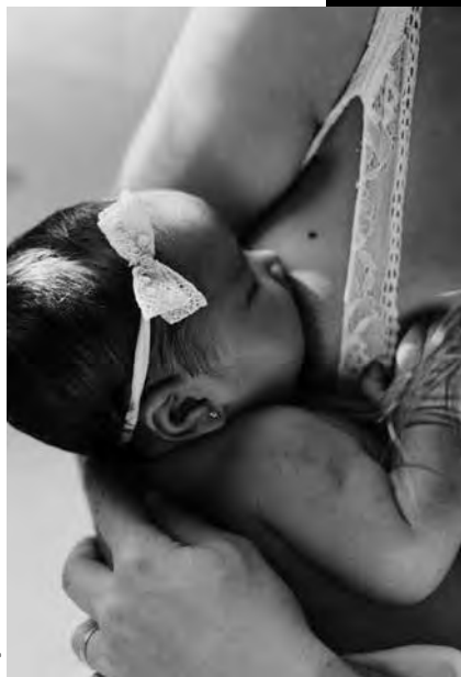
Imagen: Lucas Mendes