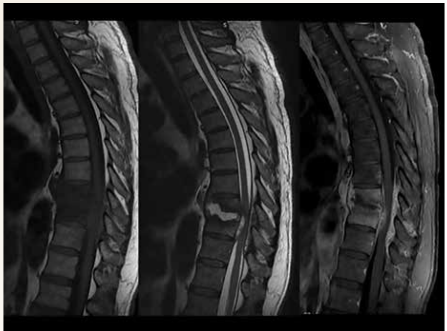
Figura 2. Imágenes de resonancia magnética en plano sagital ponderadas en T1, T2 y T1 Gd y fat/sat