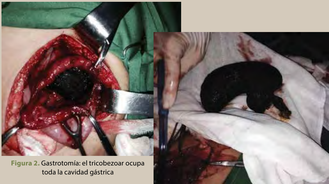
Figura 2. Gastrotomía: el tricobezoar ocupa toda la cavidad gástrica

que indicó que la magnitud de la masa impide su extracción vía endoscópica.