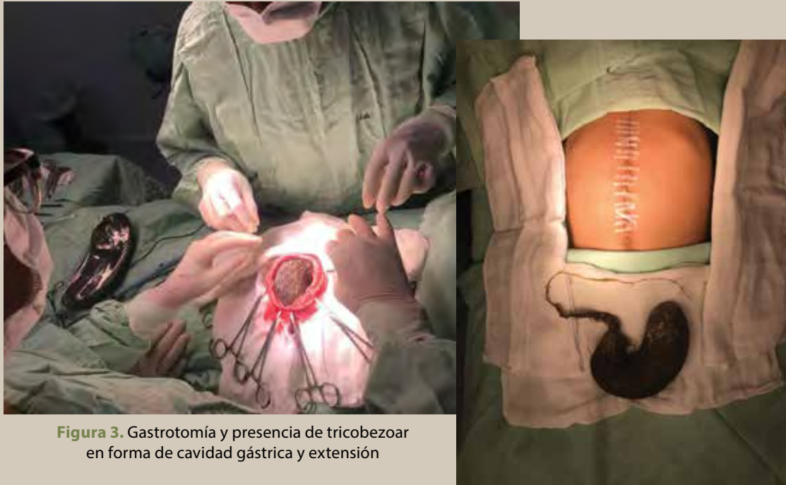
Figura 3. Gastrotomía y presencia de tricobezoar en forma de cavidad gástrica y extensión

desnutrición secundaria y diagnóstico diferencial de fecaloma, neuroblastoma o linfoma.