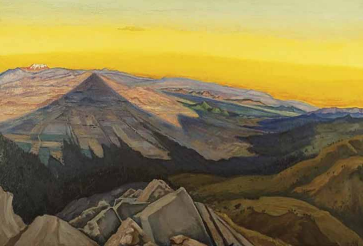
La sombra del Popo, 1942

Por sus trabajos sobre las iglesias de México y las artes populares, mismas que lograron gran repercusión en su época, se le reconoció con la medalla “Belisario Domínguez” en 1956 y el Premio Nacional de Artes en 1958. 8