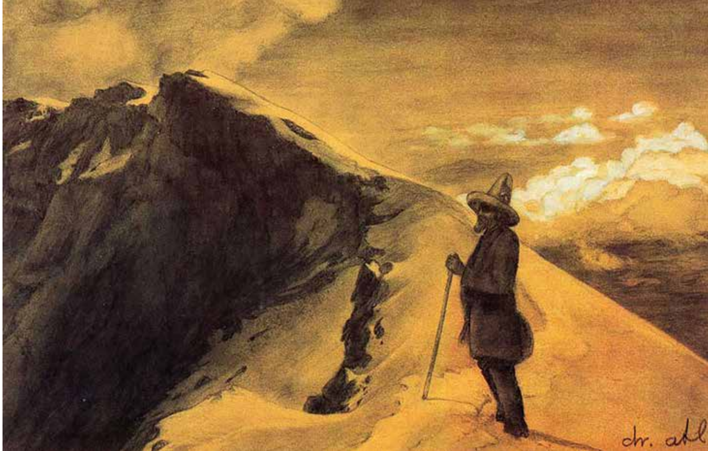
Autorretrato con volcán