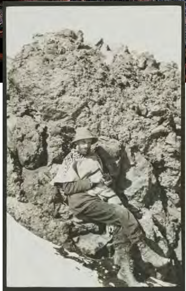
Dr. Atl en el Popocatepetl, 1922

Tan apasionante vida sólo podría surgir de quien hacía de la pasión su modus vivendi . Y si de pasión hablamos, es obligatorio asociar al Dr. Atl con su musa y pareja, Carmen Mondragón, mejor conocida como Nahui Olín, a la que ya hemos hecho referencia con anterioridad y a quien impulsó por el camino del arte. Su carácter explosivo y su demanda de amor total hicieron de su pasión, una que al mismo tiempo destruye. La relación se rompió y concluyó mal cuando ella estuvo a punto de terminar con la vida de su mecenas, al intentar dispararle mientras éste dormía 7 .