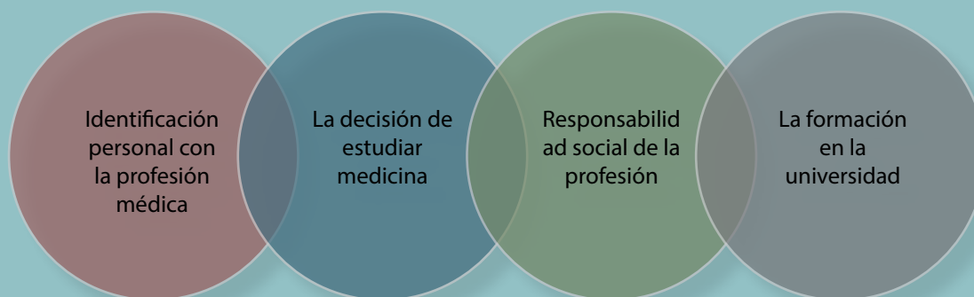
Figura 1. Construcción de la identidad profesional en estudiantes de medicina

Los estudiantes son influenciados por las experiencias vividas: el estilo de crianza, sexo, grupo social al que pertenecen, genética, cultura, religión y estatus socioeconómico, entre otros. Sin embargo, la IP se desarrolla a través de relaciones interpersonales en contextos profesionales. La experiencia adquirida en los encuentros directos con los pacientes y sus familiares, la muerte de un paciente y la primera visualización de una operación, tienen un papel poderoso en la configuración de la IP.