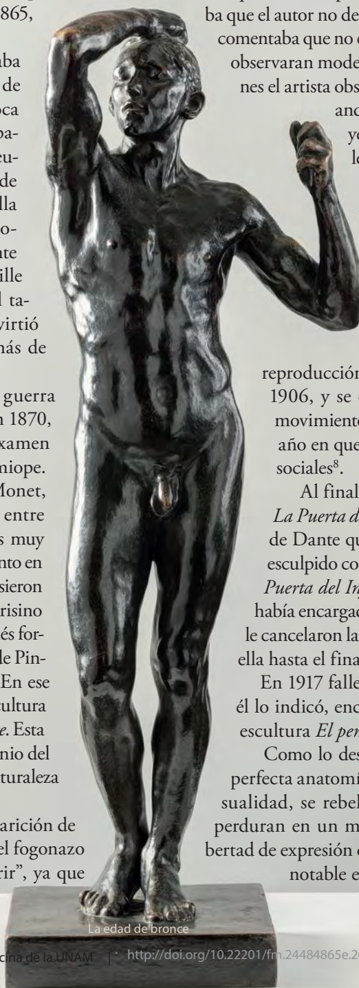
La edad de bronce

Como lo describiría Rodin, sus obras, con perfecta anatomía y repletas de vitalidad y sensualidad, se rebelan contra la muerte, ya que perduran en un movimiento plasmado en la libertad de expresión que fue la característica de este notable escultor. ●