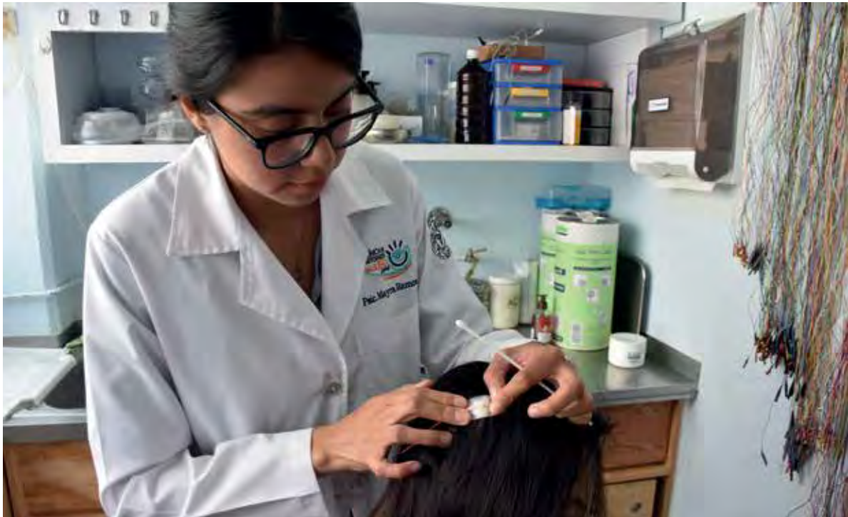
Figura 3. Fotografía que muestra la colocación de los electrodos de registro electroencefalográfico en la piel de la cabeza de un paciente