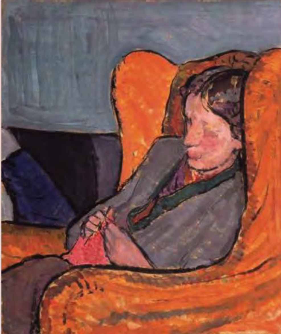
Retrato de Virginia Woolf, realizado por su hermana, la artista Vanessa Bell, 1912

escritora adelantada a su tiempo, que tuvo que lidiar con lo que ahora se cree fue un trastorno bipolar, el cual la hundía en profundos periodos depresivos y otros de agitación extrema.