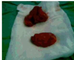
Figura 5. Ambas tumoraciones resecadas