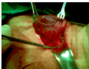
Figura 4. Resección de la prolongación mediastínica