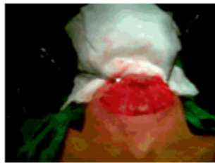
Figura 2. Tumor del cuello expuesto

Se procedió a la intervención quirúrgica de la paciente con exéresis de la tumoración, que fue informada por el departamento de anatomía patológica como un bocio multinodular. (Figuras 2, 3, 4,5).