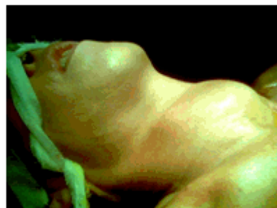
Figura 1. Paciente con tumor de cuello

Se presenta el caso de una paciente de sexo femenino, de 59 años de edad que refirió haber presentado desde hacía 2 años aumento de volumen del cuello, acompañado de decaimiento, palpitations y disfagia. Al examen físico se constató la presencia de una tumoración que ocupaba la región antero-inferior y lateral derecha del cuello, movable, que se prolongaba hacia abajo a la parte superior del tórax. (Figura 1).