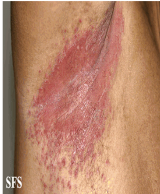
Figura 3. Lesiones eritematosas de bordes mal definidos en región axilar acompañadas de macerado blanquecino. Presencia de lesiones satélites