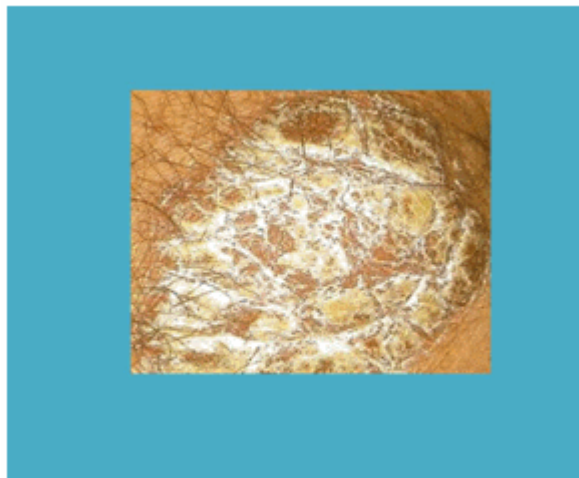
Figura 1. Placa eritematoescamosa en codos y rodillas

Las manifestaciones clínicas de la psoriasis vulgar están constituidas por eritemas de diferentes tonalidades, escamas blanconacaradas, friables, que forman placas de diferentes dimensiones, formas, localización y bordes precisos, con los característicos signos patognomónicos. Hay variedades de psoriasis especiales o complicaciones como son: variedad pustulosa, artropática y eritrodérmica. (Figura 1)