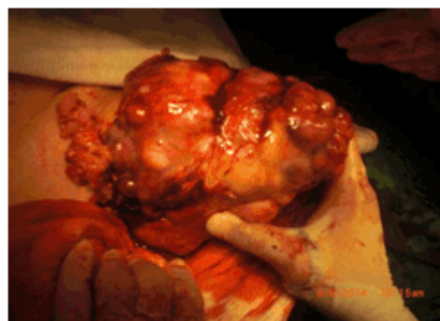
Figura 3. Acto quirúrgico. Extracción del tumor de 15 x 19 cms

Informe operatorio: se comprobó la existencia de un tumor sólido que emergía de la raíz del mesenterio y desplazaba las asas intestinales y colon. Poseía irrigación de intestino delgado y grueso. Se realizó exéresis y se reseco el meso adjunto. Se envió al departamento de anatomía patológica. No se detectan ganglios patológicos ni metástasis en hígado. (Figura 3).