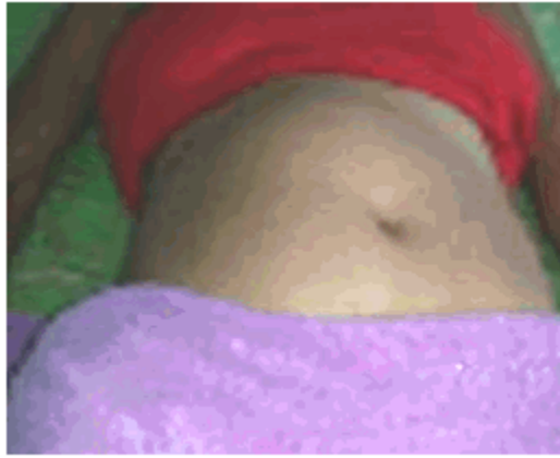
Figura 1. Abultamiento del hemiabdomen derecho

Se decidió proceder al ingreso de la paciente con síndrome tumoral abdominal para realizar estudio.