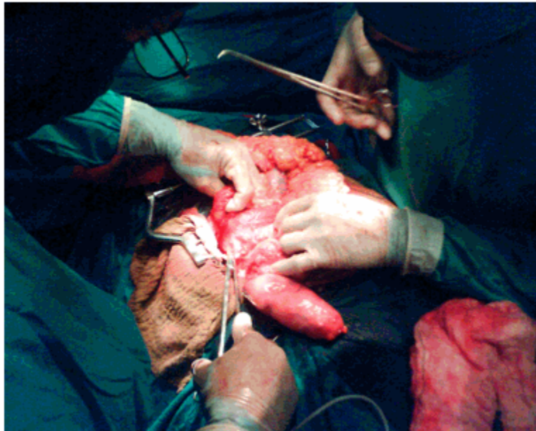
Figura 2: Momentos del inicio de la hemicolectomía

El departamento de anatomía patológica informó del apéndice. la presencia de un adenocarcinoma de la base