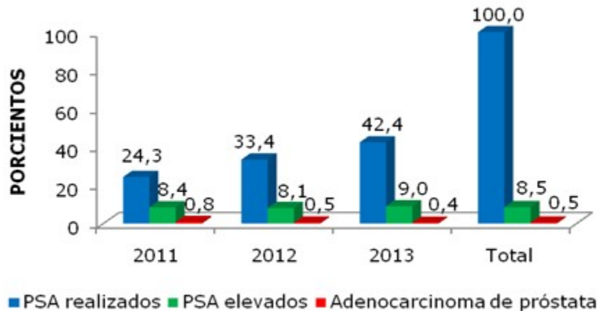
Gráfico 2. Rastreo de los resultados, relacionando los PSA realizados, los elevados y adenocarcinoma de próstata por año

los tres años, de estos pacientes examinados se demostró la presencia de adenocarcinoma de próstata en el 0,5 %. (Gráfico 2).