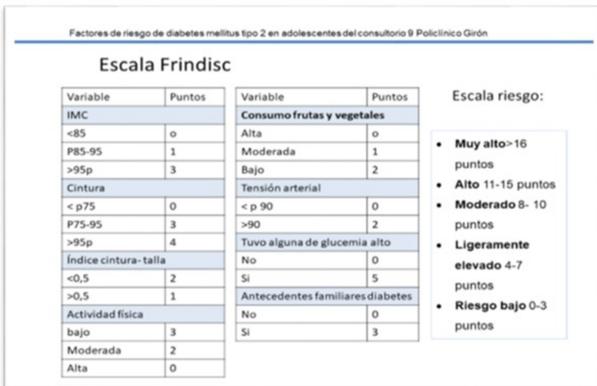
Fig 1. Escala FINDRISC para niños y a adolescentes

Los puntos de corte del instrumento fueron adaptados a los valores de referencia para niños y adolescentes cubanos.