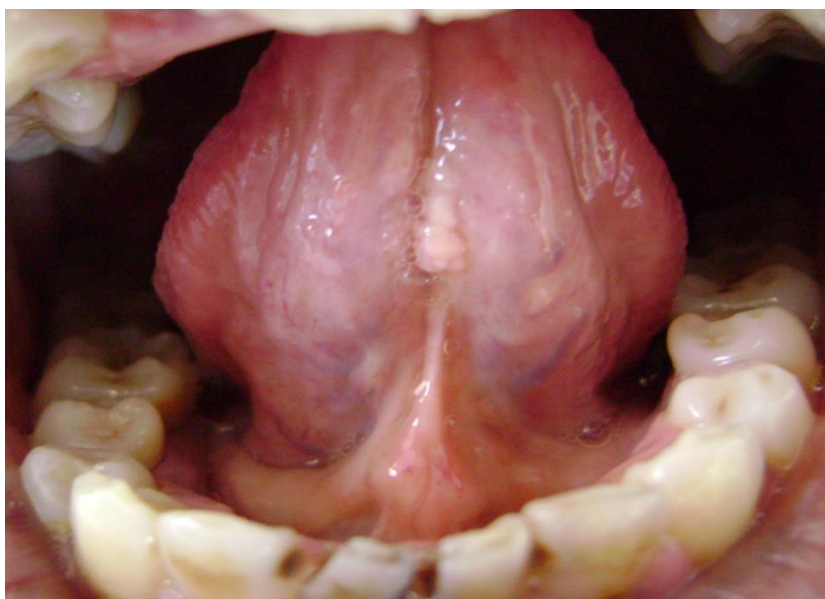
Figura 1. Neof ormación exofítica de color blanquecino localizada en la cara inferior de la lengua, con un diámetro máximo de 7 mm

Veracruzana, campus Veracruz, entre los meses de Febrero y Abril de 2017. Presenta una neof ormación exofítica multilobulada, de color blanquecino, localizada en la cara inferior tercio medio de la lengua, con un diámetro máximo de 7 mm paralelo al eje lingual (figura 1).