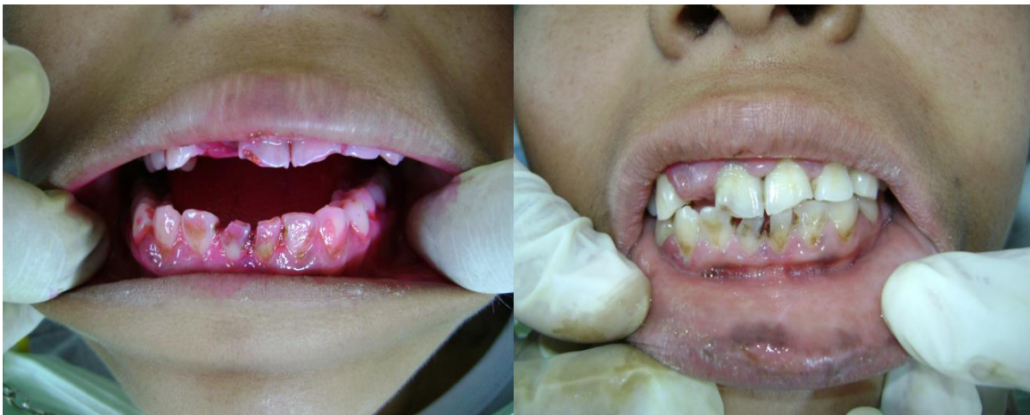
Figura 3. Del lado izquierdo se aprecian datos clínicos compatibles con gingivitis crónica marginal y papilar; del lado derecho se aprecian manchas hiperocrómicas inespecíficas en mucosa labial inferior

presentaba gingivitis crónica marginal y papilar localizada simple así como melanosia inespecífica en mucosa labial inferior (figura 3).