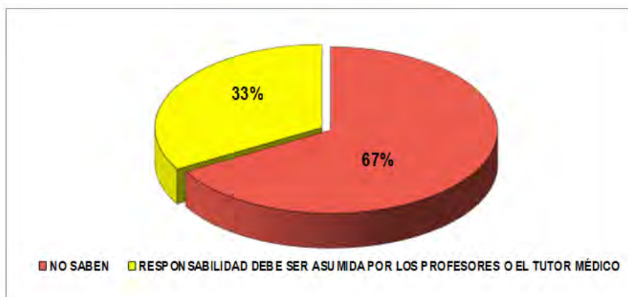
Figura 2. Responsabilidad legal de las prácticas realizadas por estudiantes de Medicina

En cuanto a la pregunta si debían ser juzgado igual que al profesional médico en caso de mala praxis médica, al momento de llevar a cabo un procedimiento de índole médico durante su periodo de pasantía, 200 (66.6%) respondieron no saber ya que ellos están en formación de pregrado. 100 (33.3%) respondieron que debían asumir esa responsabilidad sus profesores tutores, es decir, la universidad o en su defecto el médico tutor, es decir, el hospital ya que ellos estaban en formación (figura 2).