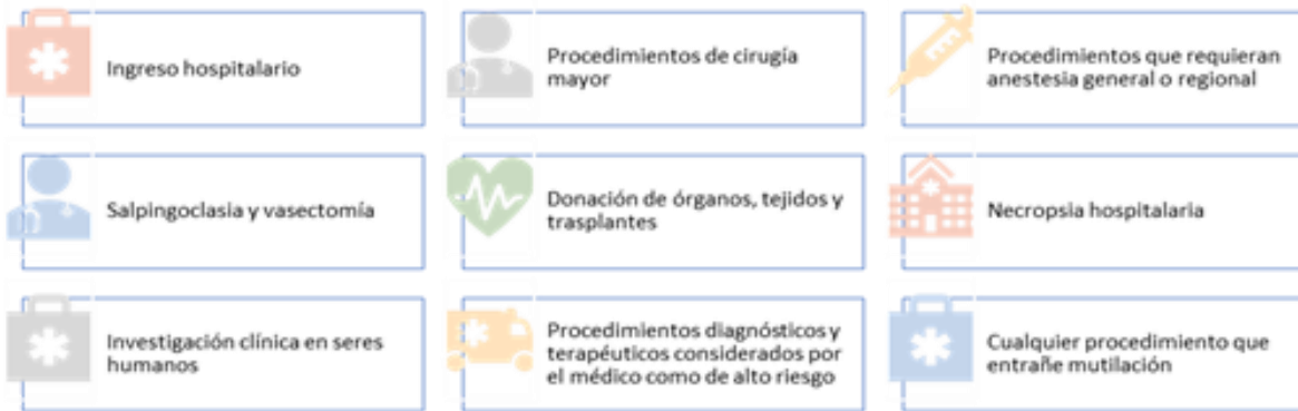
Imagen 6. Elementos mínimos que requieren de una carta.