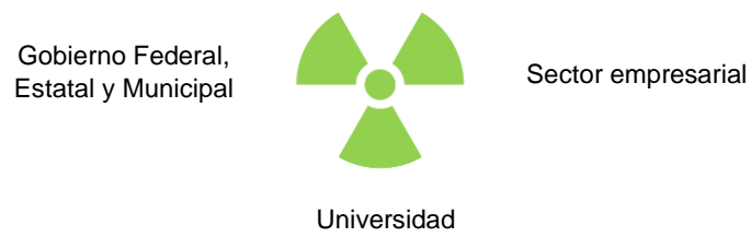
Imagen 2. Modelo triple hélice

Este modelo de innovación de triple hélice (Ver. Imagen 3 y 4), se realiza un engranaje con la academia, el sector privado y el sector público para reincorporar el consentimiento informado desde el ámbito internacional al federal, estatal y municipal.