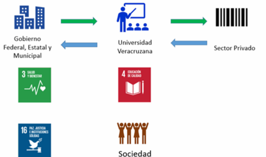
Imagen 3. Modelo de innovación de triple hélice

Este modelo de innovación de triple hélice (Ver. Imagen 3 y 4), se realiza un engranaje con la academia, el sector privado y el sector público para reincorporar el consentimiento informado desde el ámbito internacional al federal, estatal y municipal.