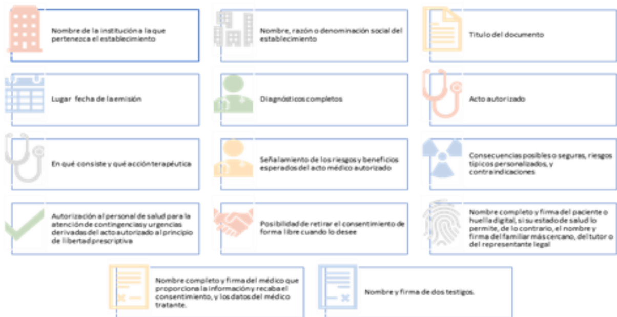
Imagen 5. Criterios que debe cumplir.

Se realiza el análisis desde el ámbito internacional con los objetivos de desarrollo sostenible (ODS) y se integran el objetivo 3: Garantizar una vida sana y promover el bienestar para todos en todas las edades; Objetivo 4: Garantizar una educación inclusiva, equitativa y de calidad y promover oportunidades de aprendizaje durante toda la vida para todos y Objetivo 16: Promover sociedades justas, pacíficas e inclusivas para Ciencias de la Salud para su incorporación en el consentimiento informado.