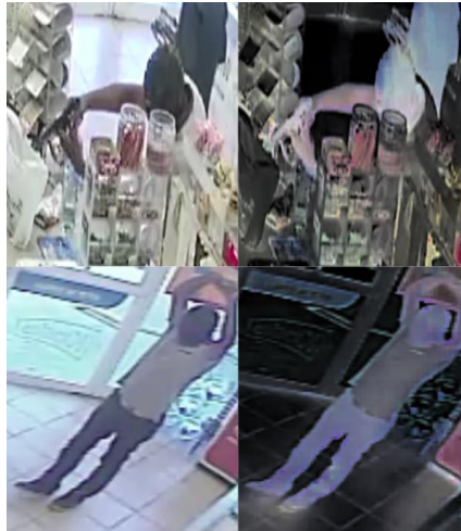
Imagen 3. Imágenes obtenidas de cámaras de videovigilancia donde se observa a un asaltante con el rostro cubierto y donde se demuestra a partir de la aplicación del método de realce de tatuajes que el sujeto en primer cuadro no tiene tatuajes en sus brazos ni antebrazos.

El método se utilizó con la intención de acreditar si el asaltante grabado en video contaba con tatuajes en sus brazos y en caso de tenerlos si coincidían con los del imputado. Al aplicar el método a una gran colección de imágenes obtenidas de las cámaras de vigilancia de los establecimientos que fueron asaltados se comprueba que la persona grabada en video no tiene tatuajes visibles, descartando que sus brazos contaran con alguna marca pictográfica o elemento de un color diferente al de su piel, con lo que quedó demostrado que el imputado no era la persona que realizó los asaltos.