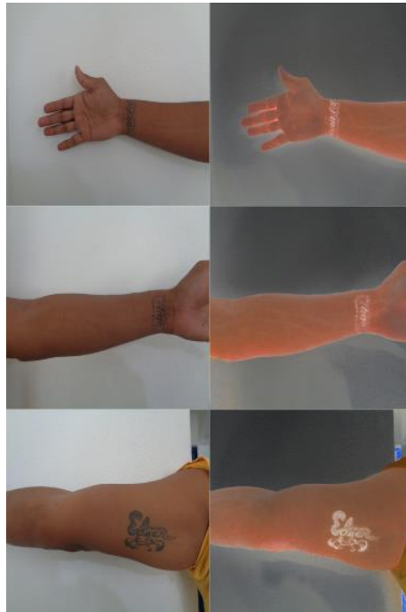
Img 2. Método de realce de tatuajes aplicado a diversos elementos pictográficos.

Finalmente teniendo separado y definido el foreground y el background lo que sigue es crear un contraste entre ambos elementos. Para lograr eso se manipula el coeficiente de difusión de la imagen, el cual si el resto de los métodos (umbralización y realce de bordes) se realizaron de manera correcta, hace que el background tienda a valores oscuros y el foreground a valores claros, lo que separa y realza el tatuaje haciendo evidente su existencia y facilitando su identificación.