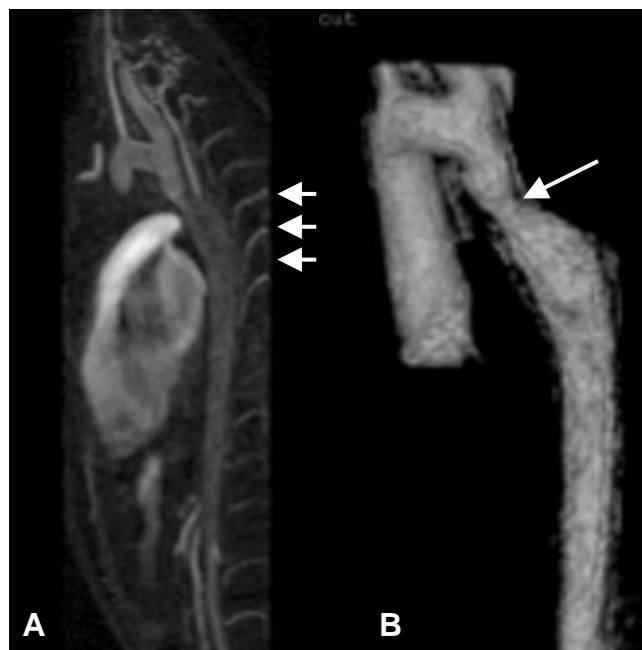
Figura 4. AngioRM. 4A. Imagen sagital de origen. Coartación aórtica postductal y prominencia de arterias intercostales (flechas) y 4B. Imagen procesada en 3D. Demuestra el sitio de estenosis formando la figura de un número tres (flecha).

El mayor hallazgo clínico es la diferencia de presiones entre las extremidades superiores e inferiores. La