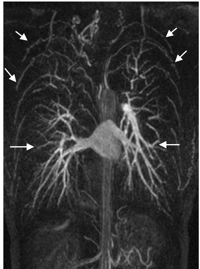
Figura 2. AngioRM coronal. Prominencia de las arterias pulmonares y de las arterias intercostales superiores debido a circulación colateral (flechas).