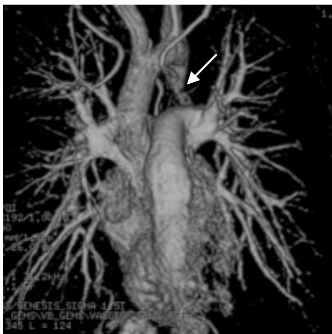
Figura 3. AngioRM en 3D. Prominencia de las arterias pulmonares y la coartación aórtica (flecha).

En el estudio de angiorresonancia de aorta torácica, con inyección endovenosa de 40 mL de gadolinio, observamos prominencia de las arterias pulmonares y sus ramas (Figura 3), así como de las arterias intercostales superiores secundaria a circulación colateral (Figuras 2 y 4A). En las adquisiciones sagitales se confirma la presencia de una estrechez de la aorta torácica en su porción alta de tipo postductal con una longitud aproximada de 15 mm (Figura 4B).