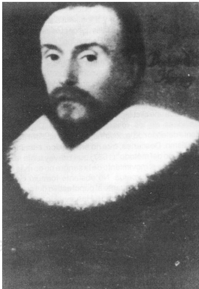
Figura 2. William Harvey (1578-1657).

adulteraban los textos clásicos, mas nadie pensó en desechar o reemplazar a los antiguos. 8 Por lo que atañe a Harvey, se consideró aristotélico y galenista hasta el fin de sus días. Su descubrimiento de la circulación sanguínea se considera actualmente como el único adelanto fisiológico de principios del siglo XVII, comparable a los avances contemporáneos de las ciencias físicas. La historia de tal hazaña podría escribirse fácilmente desde el punto de vista del avance progresivo del conocimiento. El médico de Folkestone se refería a experimentos auténticos -no imaginados- y aducía irrefutables argumentos cuantitativos. Se ha sugerido con justicia que su obra fuera la primera explicación adecuada de un proceso orgánico y el punto de partida de la fisiología experimental. Después de él, cambió la actitud de los científicos ante los fenómenos vitales. No sólo descubrió la circulación sistémica y el papel real de la actividad cardiaca, sino que aportó al siglo XVII, en que germinaban nuevas formas de pensamiento, una profunda renovación del razonamiento médico, hasta entonces esclavo de la formidable influencia de las tradiciones antiguas. En aquella época, el pensamiento científico moderno estaba naciendo trabajosamente.