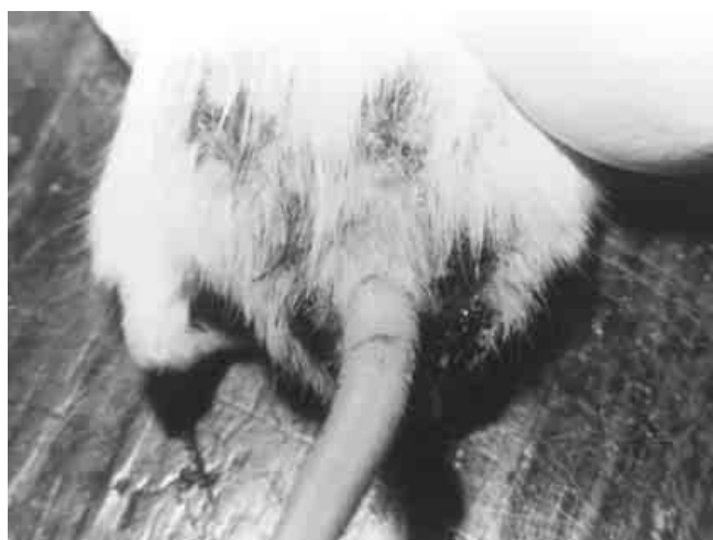
Figura 2. Esporotricosis experimental. Forma diseminada.