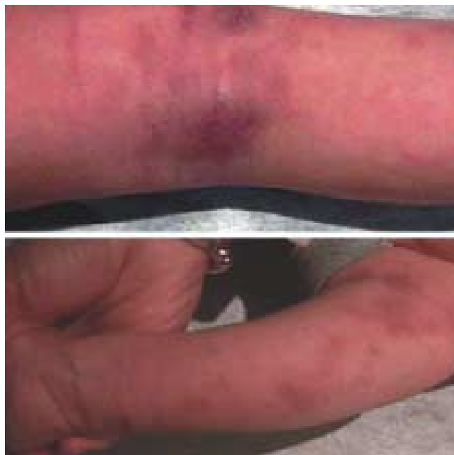
Figura 1. Presencia de lesiones cutáneas características del WAS: eccema infectado en el pliegue de la rodilla, brazo y antebrazo, coincidiendo con hematomas.

El estudio citomorfológico de la médula ósea, mostró aumento de la celularidad, presencia de algunos megacariocitos, no productores de plaquetas y discreta detención de la serie mieloide. Los estudios de inmunohistoquímica con mínima reacción para CD42 en plaquetas y reactividad normal con anti-CD43, proteína de transmembrana que identifica principalmente a linfocitos T, pero no a células B (Figura 2).