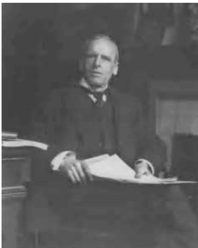
Figura 3. Ernest H. Starling, Profesor de Fisiología en University College en Londres, en su oficina en 1921. Esta fotografía ha sido reproducida en múltiples publicaciones.

nervioso y después se propuso que el control químico, en ese momento tímidamente llamado hormonal, podría poseer un radio mayor de influencia para alcanzar la modulación y la regulación de todo el organismo. Starling se atrevió a sugerir que este mismo mecanismo de regulación química podría operar en los componentes del reino vegetal. 2,3