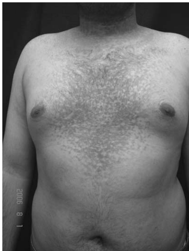
Figura 1. Aspecto clínico inicial con lesiones papilomatosas confluentes de aspecto reticulado en la periferia.

Respecto al tratamiento se ha informado el uso tópico de peróxido de benzoilo, lactato de amonio a 12%, urea, tretinoína en crema a 0.1%, clindamicina, hiposulfito de sodio a 20%, disulfuro de selenio shampoo y análogos de vitamina D, así como el uso sistémico de minociclina, etretinato e isotretinoína a dosis de 2 mg/kg/día. Otros autores consideran el uso de antimicóticos tópicos o sistémicos como miconazol, itraconazol o ketoconazol. Se han reportado buenos resultados con cualquiera de estos tratamientos, desafortunadamente con recidiva tras su suspensión.