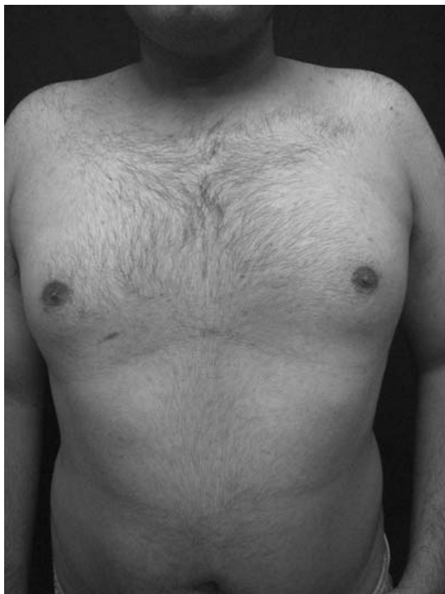
Figura 3. Aspecto clínico después del tratamiento con minociclina.

de origen fúngico a pesar del hallazgo casi constante de levaduras en el estrato córneo y de los reportes de mejoría tras tratamiento antimicótico. 3 Cabe señalar que la mayor parte de los casos que respondieron a antimicóticos también recibieron minociclina o tazaroteno. 4,5 Por otro lado, se han reseñado casos sin mejoría tras uso de antimicóticos con erradicación de la levadura, por lo que no se puede concluir que la mejoría se deba al tratamiento antimicótico. 6-8