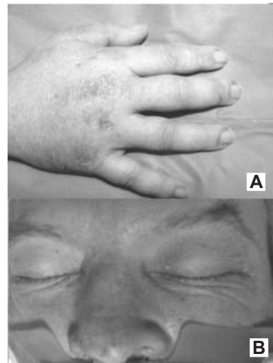
Figura 1. A) Nódulos de Gottron, caracterizados por exantema violáceo sobre articulaciones metacarpofalángicas. B) Eritema en heliotropo caracterizado por exantema violáceo alrededor de los ojos.

Anticuerpos antinucleares negativos, anticuerpos antiADN de doble cadena negativos, factor reumatoide de 37, VSG en 23, C3 (35.5) y C4 (13.5) bajos, anticuerpos antiSSA (Ro) negativos, anticuerpos antiSSB (La) negativos, antiSm negativos, anti-nRNP negativos, antiJo1 negativo, antiMPO negativos. Nitrógeno ureico, 24.6 mg/dl; creatinina, 1.4 mg/dl;