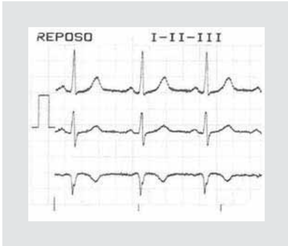
Figura 1. Electrocardiograma con derivaciones bipolares I, II y III.