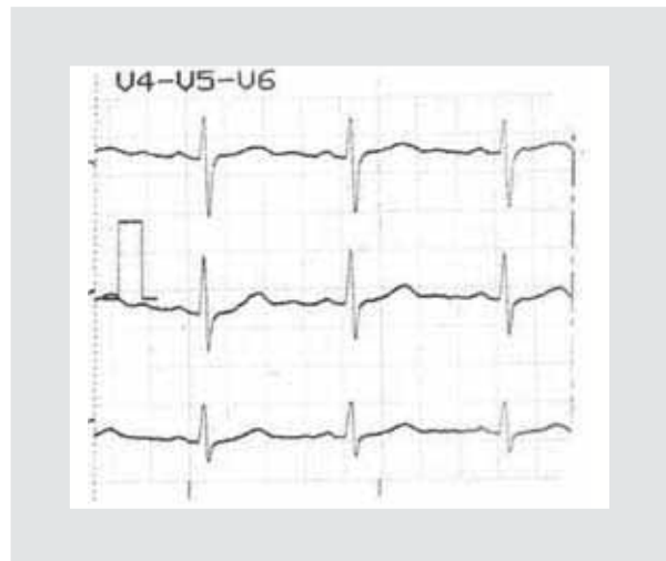
Figura 4. Electrocardiograma con derivaciones precordiales de V4, V5 y V6.

y madurez fetal acorde a la edad gestacional. Prueba sin estrés y perfil biofísico fetal reportado como normal. Una consulta por Cardiología, en donde se realiza ecocardiograma y Holter, reportándose como normales.