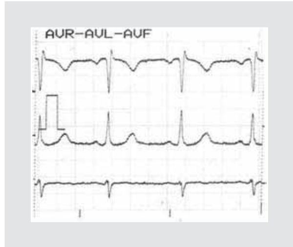
Figura 2. Electrocardiograma con derivaciones bipolares AVR, AVL y AVF.