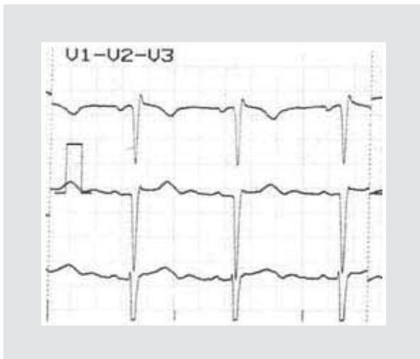
Figura 3. Electrocardiograma con derivaciones precordiales V1, V2 y V3.