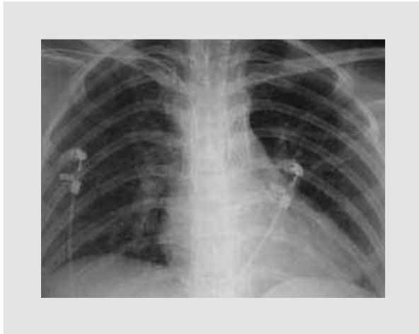
Figura 5. Radiografía de tórax, en donde se aprecia cardiomegalia con hipertrofia de ventrículo izquierdo.