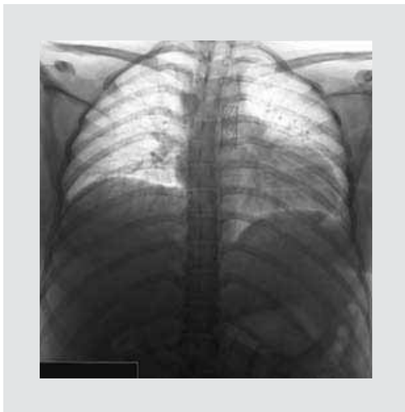
Figura 7. Radiografía de tórax en negativo para mejor visualización del Stent.