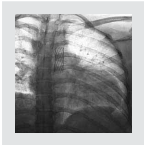
Figura 8. Acercamiento de la radiografía en negativo hacia la zona aórtica de la colocación del Stent.

con fibrosis, anatomía perdida, múltiples adherencias de epiplón a útero y vejiga. Sangrado transquirúrgico estimado en 550 ml. En la Unidad de Cuidados Intensivos Obstétricos se mantuvo vigilancia hemodinámica posquirúrgica por bioimpedancia torácica, con reporte de patrón hipovolémico, normodinámico, con resistencias vasculares sistémicas 881 dinas y su indexado en 1,376 dinas, gasto cardíaco conservado 7 lts/min, índice cardíaco 4.5 lts/min/m 2 volumen sistólico 100 ml (Fig. 6). Se mantiene vigilancia 24 horas más sin presentar descompensación hemodinámica ni endoprótesis in situ (Figs. 7 y 8), por lo cual se egresa a piso a cargo de Ginecología