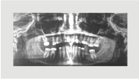
Figura 1. Elongación y calcificación bilateral del proceso estiloideo.