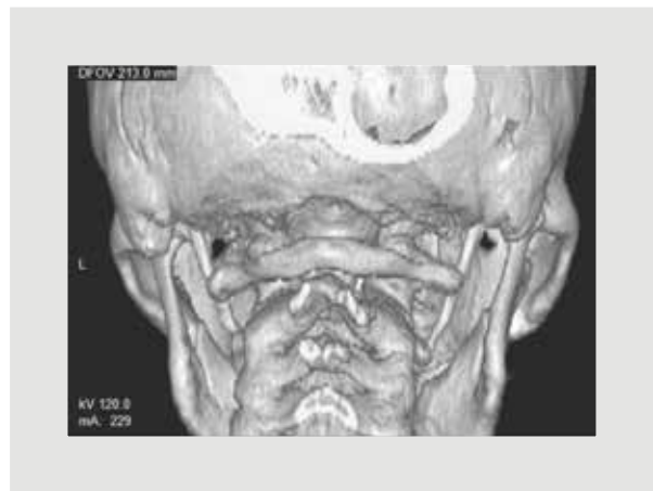
Figura 4. Tomografía con reconstrucción 3D que revela la elongación bilateral de la apófisis estiloidea.