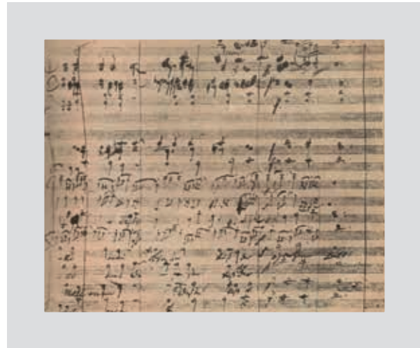
Figura 2. Fragmento del pentagrama del último movimiento de la Novena Sinfonía de Beethoven; manuscrito original (adaptado de Orlando 24 ).

200 latidos por minuto, la auscultación revelará que el primer ruido siempre tiene la misma intensidad, y de esta forma el médico estará seguro de que la secuencia atrioventricular es normal (taquicardia supraventricular) 23 . Por otro lado, al auscultar a un paciente que tiene una taquicardia con la misma frecuencia, reconocer que el primer ruido es variable en intensidad de latido a latido informa al médico de que la secuencia atrioventricular se ha perdido, y estaremos en presencia de una taquicardia ventricular 23 . Estos ejemplos demuestran que la auscultación del corazón tiene como base la imagen mental de lo que se escucha, cómo se representa la fisiología y la fisiopatología de las enfermedades del corazón en la mente del médico entrenado. En otras palabras, el diagnóstico se establece cuando el cardiólogo ve en su mente lo que está sucediendo dentro del corazón del enfermo a través de la auscultación, de la misma manera que Beethoven, estando completamente sordo, escuchó en su mente las notas musicales y, desplegando su genialidad, fue capaz de escribir la participación de cada uno de los instrumentos musicales y todas las voces que conformaban la parte coral que dio vida al poema de Schiller Oda a la alegría en el pentagrama (Fig. 2) de su portentosa Novena Sinfonía 24 .