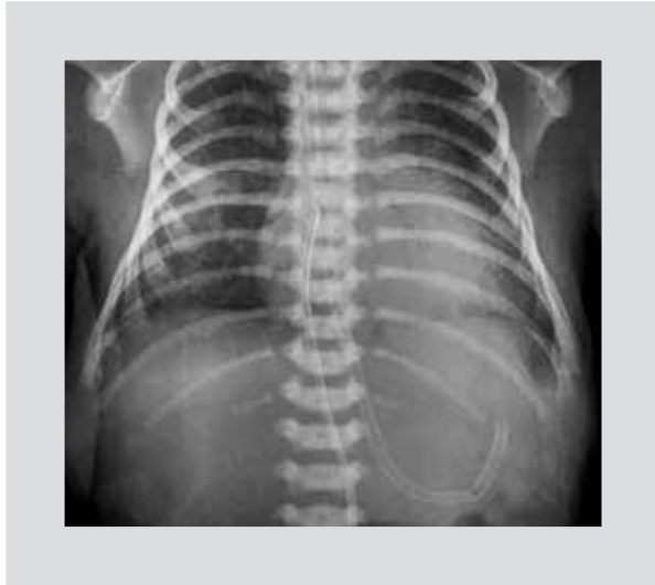
Figura 4. Placa de tórax posterior.

después de 10 días de estancia en buenas condiciones generales, sin nuevo desarrollo de derrame pericárdico.