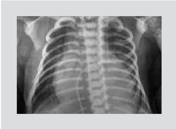
Figura 1. Placa de tórax inicial.