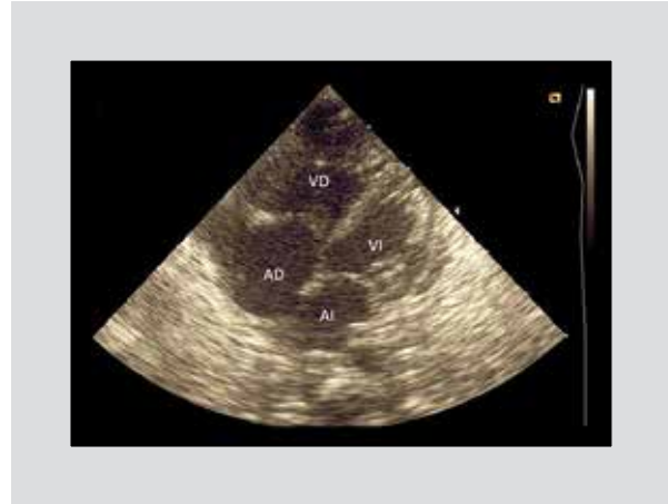
Figura 5. Ecocardiograma posterior a pericardiocentesis.

El taponamiento cardíaco ocurre cuando existe acumulación de líquido en la cavidad pericárdica, con volumen lo suficientemente grande para impedir el llenado en diástole del corazón. En lactantes, la taquicardia puede ser en ocasiones el único signo presente, incluso puede ocasionar la muerte súbita sin presencia de signos y síntomas significativos previos 18 .