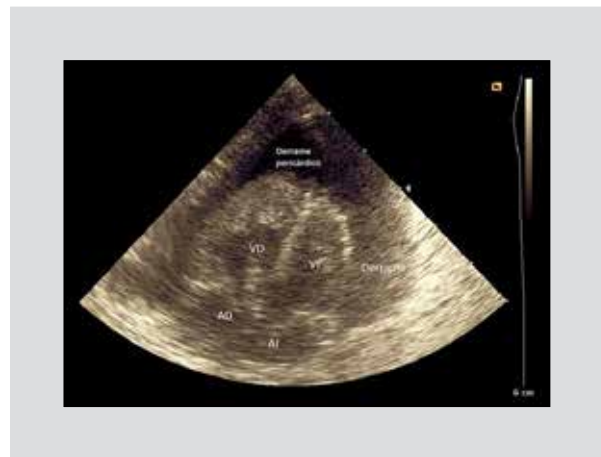
Figura 3. Ecocardiograma en eje cuatro cámaras.

Paciente masculino con antecedente de ser producto, de la tercera gestación de su madre de 35 años, aparentemente sana, a las 35 semanas de gestación por ruptura prematura de membranas y sangrado transvaginal de 8 h de evolución. El recién nacido nació vía abdominal en otra unidad. Se reportan datos de desprendimiento de placenta, requerimiento de ventilación a presión positiva con bolsa y máscara, APGAR 4/7/8, Silverman Anderson 3, peso de 2,180 g e inicialmente requirió uso de oxígeno en casco cefálico. Se le coloca CVU. El paciente progresa con mayor dificultad respiratoria, por lo que se decide intubación orotraqueal y soporte mecánico ventilatorio. Se recibe en este hospital a los dos días de vida, saturado al 97%, con datos de hipoperfusión tisular y caracterizado por taquicardia, piel marmórea, llenado capilar retardado, piel fría, pulsos disminuidos, hipoactivo, poca reactividad a estímulos y uresis disminuida; cifras tensionales aún conservadas, ruidos cardíacos normales e hígado a 2 cm por debajo del borde costal derecho. Placa de tórax con cardiomegalia, índice cardiotorácico de 0.70, punta de catéter venoso migrado, pasando por foramen oval y con punta en aurícula izquierda cercana