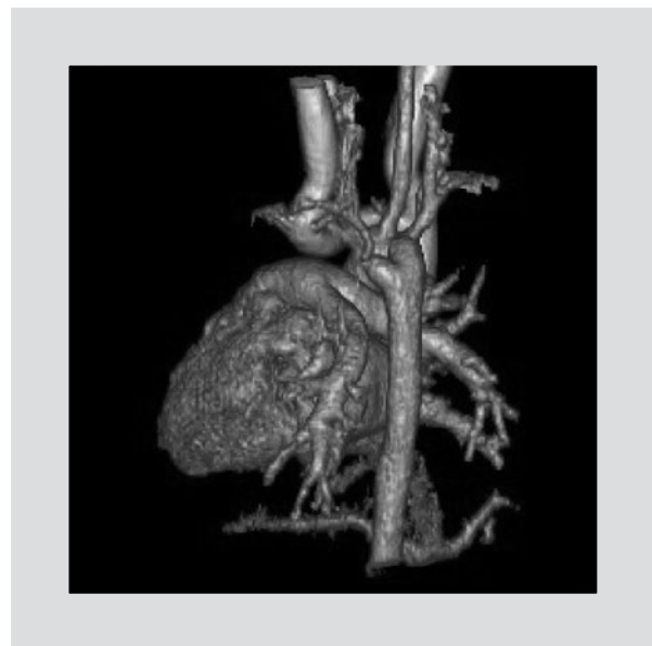
Figura 1. Reconstrucción 3D del estudio de angiotomografía computada. La visión es oblicua y se identifica la cara posterior del corazón, así como el trayecto hacia la derecha de la aorta torácica. Se aprecia el origen de la arteria subclavia en posición posterior y como último vaso del arco aórtico, que se origina de un divertículo de Kommerell.

El paciente continuó con síntomas respiratorios, estridor inspiratorio y tos traqueal; es sesionado en conjunto con el servicio de cirugía cardiovascular concluyéndose que era candidato a tratamiento quirúrgico. Se realizó una sección y sutura del anillo vascular, además de la pexia del arco aórtico sin complicaciones; actualmente se encuentra asintomático.