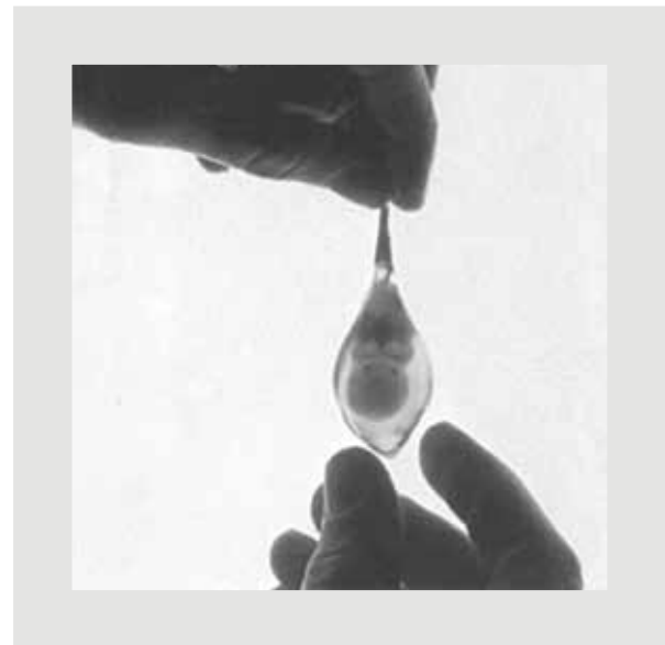
Figura 1. Esta extraordinaria fotografía de un embrión en su saco amniótico intacto la tomó, tras una cirugía que fue requerida debido a un embarazo ectópico (en la trompa de Falopio), el médico y fotógrafo Robert Wolfe en la Universidad de Minnesota, EE.UU., en 1972.