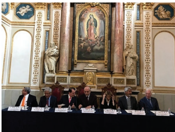
Figura 5. Segunda reunión entre el Consejo de Academias Nacionales de los Estados Unidos de Norteamérica y el Consejo de Academias Nacionales de México, celebrada el 15 de febrero de 2018 en el Palacio de Minería de la Ciudad de México.