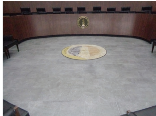
Figura 10. Medallón de bronce fundido con el emblema de la Academia Nacional de Medicina de México, diseñado por el maestro Pedro Ponsanelli.

Se colocó también una placa de bronce con el nombre de la ANMM a la entrada del vestíbulo, protegida por una estructura de acero y cristal e iluminada mediante un tubo de luz regulado por una fotocelda. Se redistribuyeron los seis bustos que ya existían en el vestíbulo y se agregaron cuatro más que se tenían en bodega o se encontraban en el segundo piso del