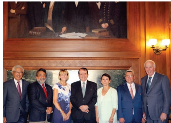
Figura 4. Primera reunión celebrada en agosto de 2017 en la ciudad de Washington DC entre el Consejo de Academias Nacionales de los Estados Unidos de Norteamérica y el Consejo de Academias Nacionales de México.